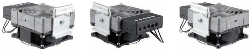
Крепление на DIN-рейку