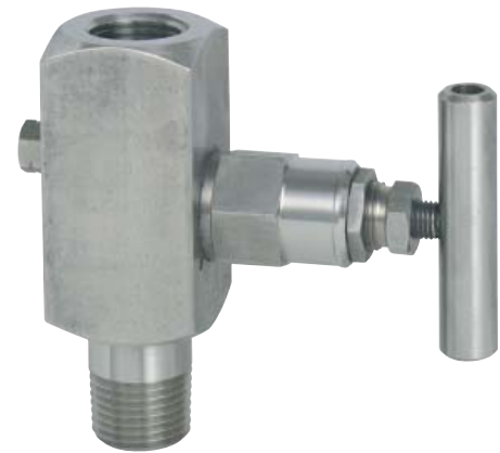
Запорный вентиль Barstock, Форма 2, Цапфа/Муфта 1/2 NPT, PN 420, DN 5