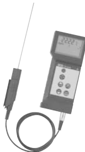
Цифровой термометр СТН 6500